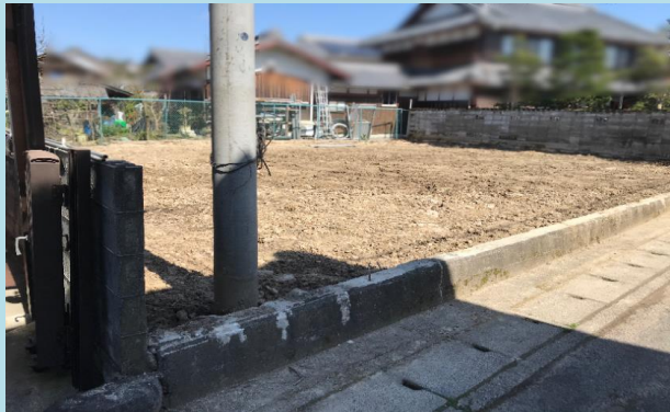
※本図は略図ですので、現況と異なる場合は、現況有姿とさせていただきます！